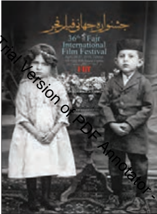
■ جشنواره جهانی فیلم فجر هر ساله در تهران برگزار می‌شود و مهم‌ترین جشنواره سینمایی ایران است.