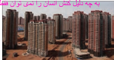
به چه دلیل کنش انسان را نمی‌توان فقط با روش تجربی تحلیل کرد؟

■ «اُردُس» بزرگ‌ترین شهر متروکه جهان است که با وجود سرمایه‌گذاران برنامه‌ریزی دولت چین برای تشویق و ترغیب هزاران نفر به سکونت در آن، تقریباً خالی از سکنه مانده و شهر ارواح لقب گرفته است.