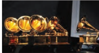
■ جشنواره‌های فیلم و موسیقی برای داوری بهترین‌ها دنیای هنر