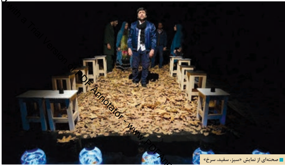
صحنه‌ای از نمایش «سبز، سفید، سرخ»