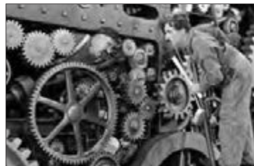
■ انسان در فیلم سینمایی «عصر جدید»، شیء و در فیلم سینمایی «تلقین»، موجودی آگاه دانسته شده است.

هر عبارت به کدام یک از رویکردهای جامعه‌شناسی اشاره دارد؟ دی ماه 98 و 99 (.....) (الف) برآنچه مشاهده میشود تمرکز دارد ..... (ب) آگاهی و معناداری را مهمترین ویژگی کنش اجتماعی میداند