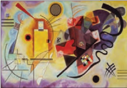
■ زرد، قرمز، آبی اثر واسیلی کاندینسکی، خالق نقاشی های مدرن انتزاعی. این نقاشی ها، تفسیر عمیقی با خود دارند و چیزی که در ظاهر به نظر می رسند، نیستند. شکل ها و رنگ ها به واقعیتی مشخص بیرون از ذهن اشاره ندارند.

همراهی همدلانه به چه معنا نیست؟ دیماه 98 به معنای تأیید کنشگران نیست