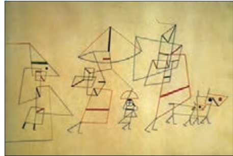
■ گردش خانوادگی اثر پاول کله. به گفته او در ورای ابهام، رمز و رازی نهفته است که با هنر می توان به آن راه یافت.

۱- با اینکه فضای مجازی معنای به روز بودن را در خود دارد ولی سبب می شود که فرد کاربر از زمان و مکان خودش جدا شود، با وجود دسترسی به مطالب زیاد و متنوع از دسترسی به مطالب مهم محروم گردد، با وجود آزادی و قدرت، تحت کنترل قرارگیرد و با وجود سرگرم شدن، سطحی شود.