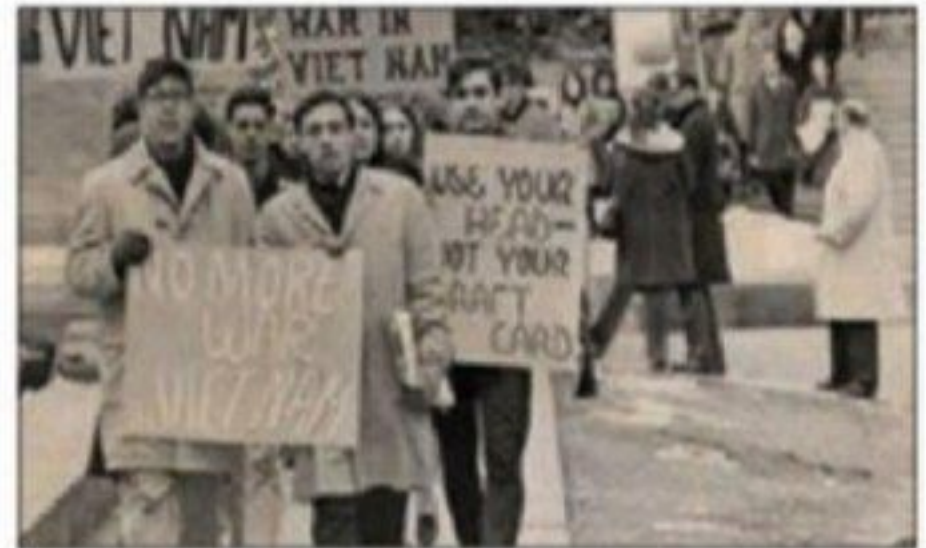
■ دهه شصت میلادی عصر اعتراض سیاه‌پوستان، سر بر کشیدن دوباره جنبش زنان، جنبش دانشجویی و جنبش ضد جنگ ویتنام بود. ویژگی‌های جامعه‌شناسی انتقادی را بنویسید.

۱ بدین ترتیب از درون رویکرد تفسیری، نوع جدیدی از جامعه‌شناسی به نام «جامعه‌شناسی انتقادی» پدید آمد ۲ که به توصیف و تبیین پدیده‌های اجتماعی بسنده نمی‌کند ۳ بلکه به داوری ارزشی پدیده‌های مورد مطالعه می‌پردازد ۴ و آن را با ملاک‌های ارزشی (خوب و بد) و هنجاری (باید و نباید) ارزیابی می‌کند. ۵