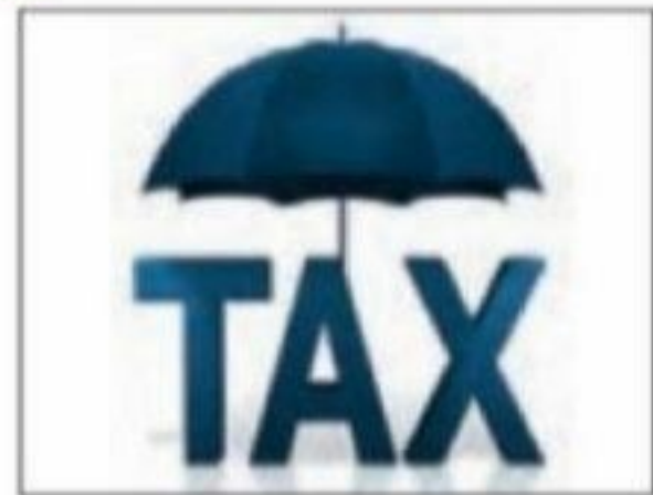
■ مالیات ایزاری برای کاهش فاصله طبقاتی

تصاویر از تلاش دولت برای کاهش نابرابری اجتماعی است. مثل گرفتن مالیات از ثروتمندان برای حمایت از اقشار کم‌درآمد - برای حمایت از اقشار کم‌درآمد آن‌ها را زیر چتر حمایت بیمه‌های اجتماعی قرار می‌دهند. در برزیل برای اقشار کم‌درآمد طرح خانه‌سازی عمومی اجرا میشود