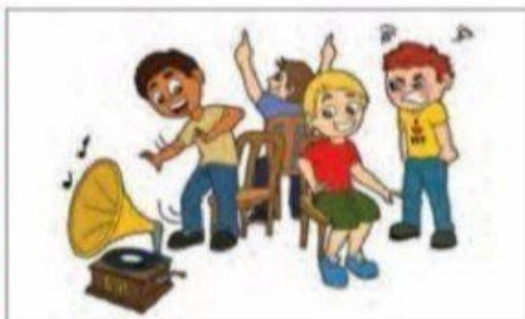
■ صندلی بازی یک بازی گروهی است که اگر صرفاً با نگاه رقابتی انجام شود، روحیه خودخواهی را تقویت و همکاری را تضعیف می کند.

طرفداران رویکرد اول، در بحث رقابت، از کدام نکته غفلت دارند؟