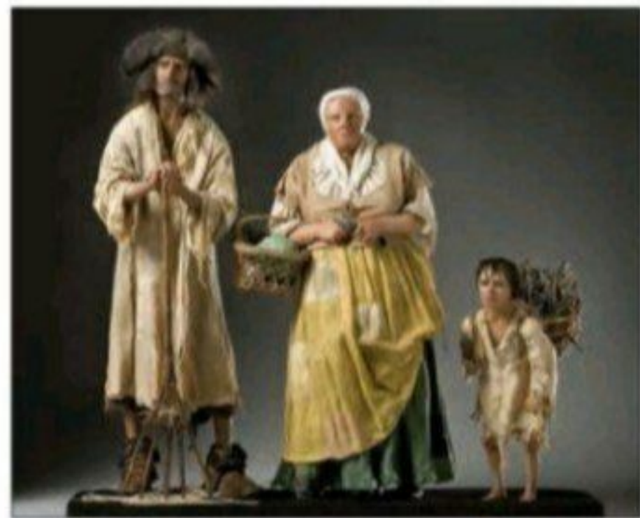
■ در نظام فئودالی دهقانان شبیه برده بودند؛ مالک چیزی نبودند و به فئودال تعلق داشتند.

مثالی برای مدل لیبرالی که معتقدند از گذشته تا کنون هیچ جامعه ای بدون قشربندی نبوده است و قشربندی پدیده ای است که در همه زمان ها و مکان ها وجود داشته و شکل های مختلفی از قشربندی تجربه شده است و به همین دلیل است که پدیده طبیعی است و باید وجود داشته باشد.