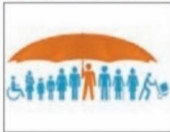
■ دولت‌ها برای حمایت از اقشار کم‌درآمد آنها را زیر چتر حمایت بیمه‌های اجتماعی قرار می‌دهند.