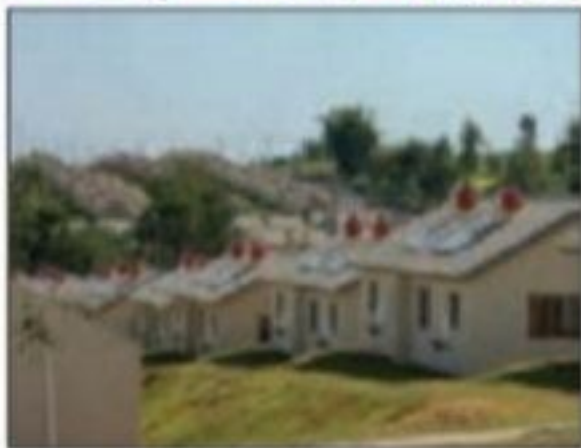
■ طرح خانه‌سازی عمومی برای اقشار کم‌درآمد در برزیل

در رویکرد عدالت اجتماعی دولت چگونه برای کاهش نابرابری‌ها تلاش می‌کند؟ خرداد ۹۹، دی ۱۴۰۰ در رویکرد عادلانه دولت چگونه تلاش می‌کند نابرابری‌های اجتماعی را کاهش دهد؟ خرداد ۱۴۰۰ در رویکرد برابری دولت برای یکسان کردن نقطه شروع و رقابت چه وظیفه‌ای دارد؟ خرداد ۱۴۰۲