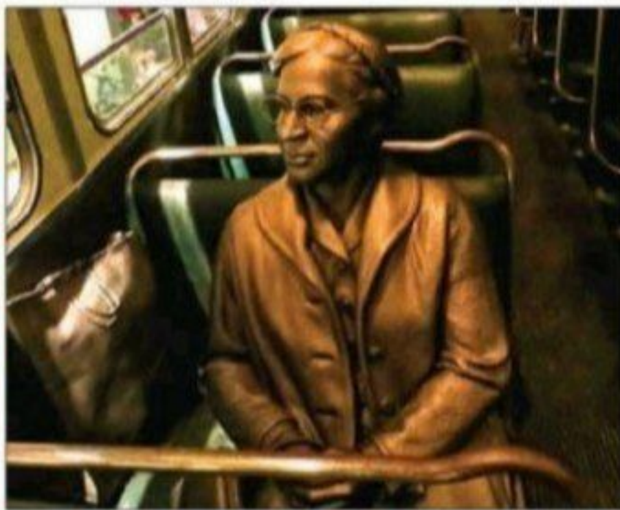
■ رزا پارکس، زن سیاهپوست آمریکایی که حاضر نشده بود جای خود را در اتوبوس به یک مرد سفیدپوست بدهد و به همین علت بازداشت و جریمه شد.

این واقعه در ایالت آلا باما سال ۱۹۵۵ اتفاق افتاد که در آن زمان بین سیاهپوستان و سفیدپوستان تبعیض وجود داشته و در وسایل حمل و نقل در طول مسیر یک سفیدپوست وارد اتوبوس می شد و صندلی خالی نبود. یک سیاهپوست موظف بود صندلیش را به او بدهد. پس از خودداری رزا پارکس از دادن جای خود به سفیدپوست در اتوبوس وی دستگیر و جریمه شد و این ماجرا باعث تشویق سپاهیان برای دستیابی به حقوق خود شد.