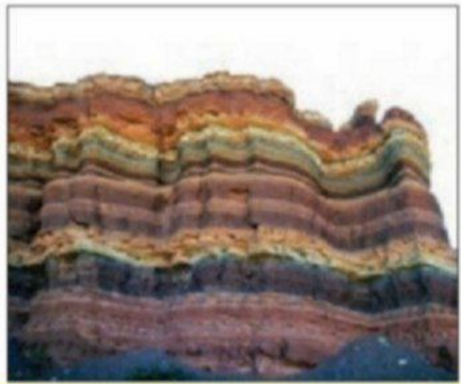
■ مفهوم قشربندی در جامعه‌شناسی، از زمین‌شناسی گرفته شده است و جامعه‌شناسان زمین‌دارای لایه‌بندی سلسله‌مراتبی دانسته شده است.

اما آیا وجود نابرابری‌های اجتماعی برای جامعه ضرورت دارد؟ یا اینکه برای برقراری عدالت اجتماعی باید با نابرابری اجتماعی مبارزه کنیم و همه افراد و گروه‌ها را برابر نماییم؟ در پاسخ به این پرسش‌ها، رویکردهای متفاوتی وجود دارد؛