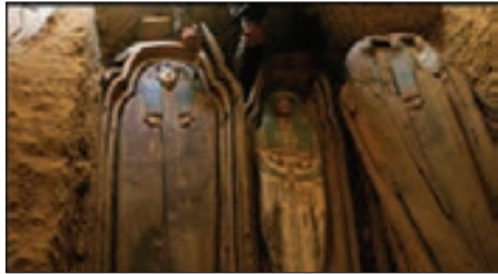
■ تابوت‌های رنگارنگ مومیایی تمدن مصر

۹۷ دی شهریور ۹۸ شهریور ۴۰۳ فارابی جوامعی را که از علوم عقلی بی بهره‌اند، «مدینه جاهله» نامیده است. در جوامع جاهله علم ابزاری می‌تواند وجود داشته باشد اما علمی که از ارزش‌ها، آرمان‌ها و حقیقت زندگی سخن بگوید، وجود ندارد. ۱۳. از دیدگاه فارابی مدینه جاهله چه ویژگی‌هایی دارد؟