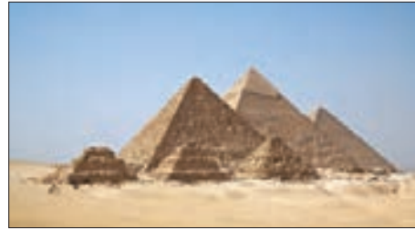
■ اهرام جیزه نقطه اوجی در تکامل شیوه معماری مقابر مصر در دوره پادشاهی کهن است.

۹۷ دی ۹۸ خرداد شهریور ۱۴۰۰ دی ۱۴۰۳ فارابی جامعه‌ای را که بر محور علم سازمان یافته باشد، مدینه فاضله می‌نامد. مدینه فاضله،